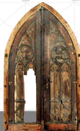
Tür des Nordportals; 19.Jh.; konserviert und ausgestellt 2015