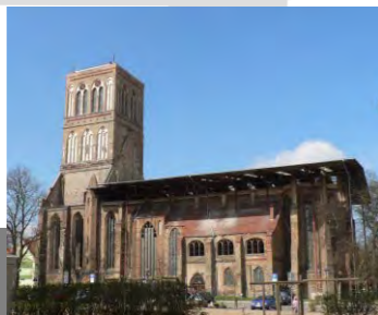
Kirche um 2008