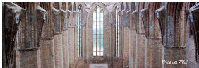
Kirche um 2008

1999 Renovierung der Sakristei; Provisorische Verglasung des Kirchenschiffes mit Kunststoff